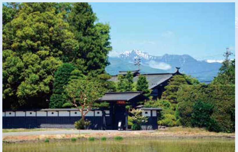
築166年 安政の本棟造り 南涯館

◆チケット代 ●大人〈前売券〉3,500円 (当日券4,000円) ●高校生以下〈前売券〉1,500円 (当日券2,000円)