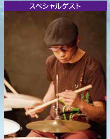
スペシャルゲスト