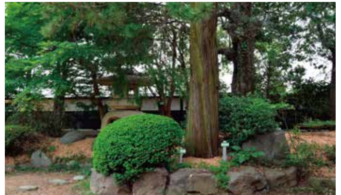
木曽の五木 樹齢300年のコヤマキ

2004年に山梨へ移住後はブラジル音楽に傾倒し、ギター弾き語りスタイルでのライブ活動を開始。2008年1st Album「雨粒」をはじめ、カバー作品を含む計5枚のCDをリリース。 2022年ピアニストgee2wo氏と新ユニット「7g classic's」を結成しアルバムを発表。山梨、長野の他、都内～関西方面でもライブ活動を行っている。 ホームページ https://nanamari.com/