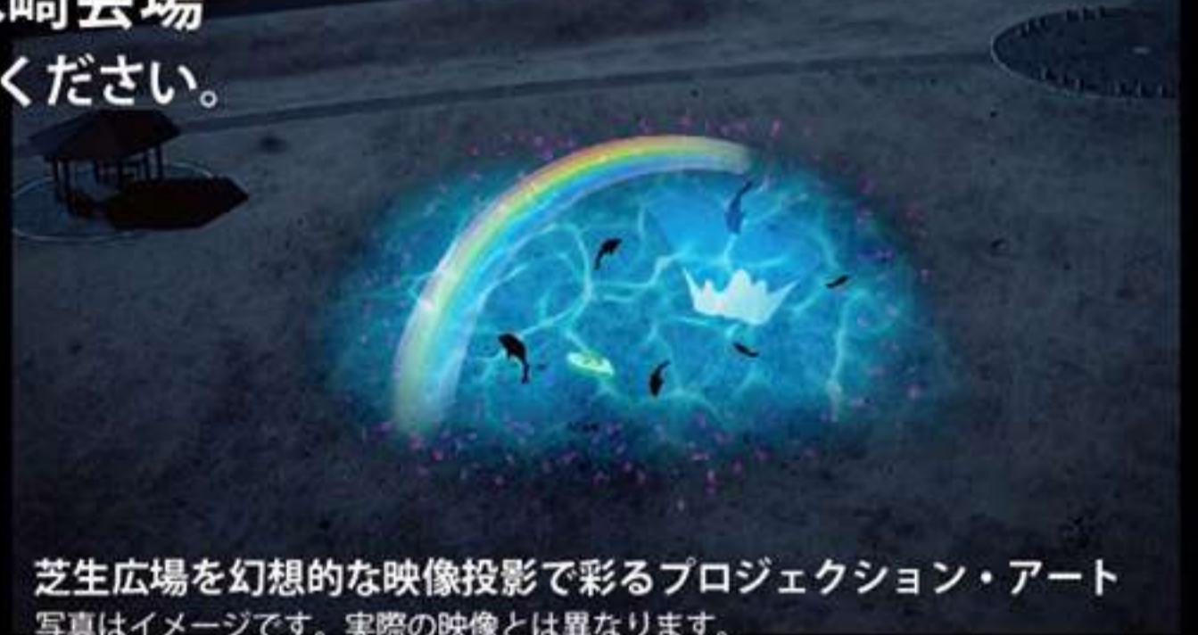
芝生広場を幻想的な映像投影で彩るプロジェクション・アート 写真はイメージです。実際の映像とは異なります。